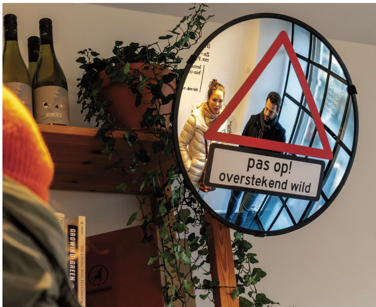
Wild buiten en wild binnen - Foto's: Rob Godfried

Een nieuw initiatief in De Pijp voor wie (eigenlijk) geen vlees wil eten