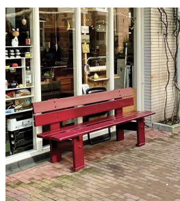
De Aanzet (020) 673 34 1506

Voor de betreffende jongens hebben we taart als jullie 'm weer terug brengen.