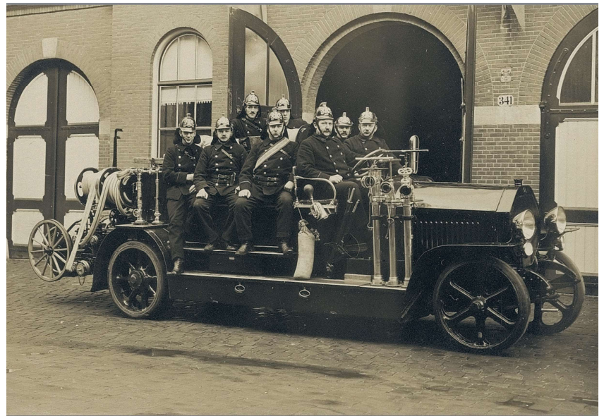
Brandweerauto van Ostadestraat

De kazerne was vierentwintig uur per dag bemand, zodat er ook 's nachts gelijk uitgerukt kon worden. De brandweerlieden die 's nachts dienst hadden sliepen in de kazerne. Op de eerste verdieping waren de slaapplekken, een badkamer met bad en een geiser voor warm water. Er was een wachtkamer waar men de avond door kon brengen.