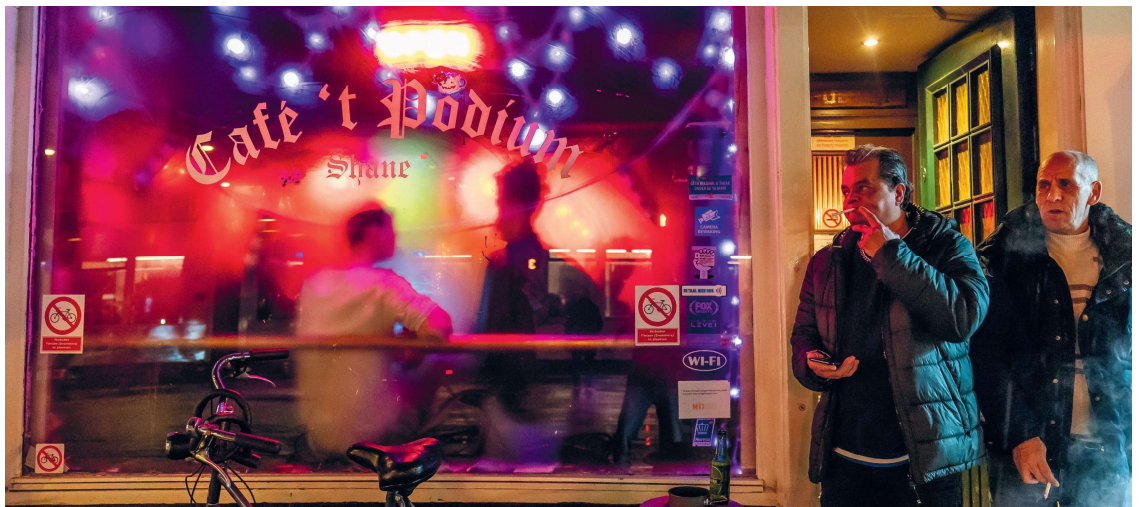
Pui van 't Podium

Overdag zou je haast voorbij Café 't Podium Shane lopen zonder dat je er erg in had. Het front van het Café is vrij smal, wat maakt dat het tussen het passantengevaarte op het kruispunt Ferdinand Bol en Ceintuurbaan, niet meteen opvalt. Daarbij beschermt het verkleurde gordijn achter de voorruit de brocante charmes tegen pottenkijkers overdag. Het Keltische font van het logo verraadt al enige historie. Zodra tegen een uur of drie 's middags het gordijn opengaat, wenkt het Café meteen tot binnenkomst.