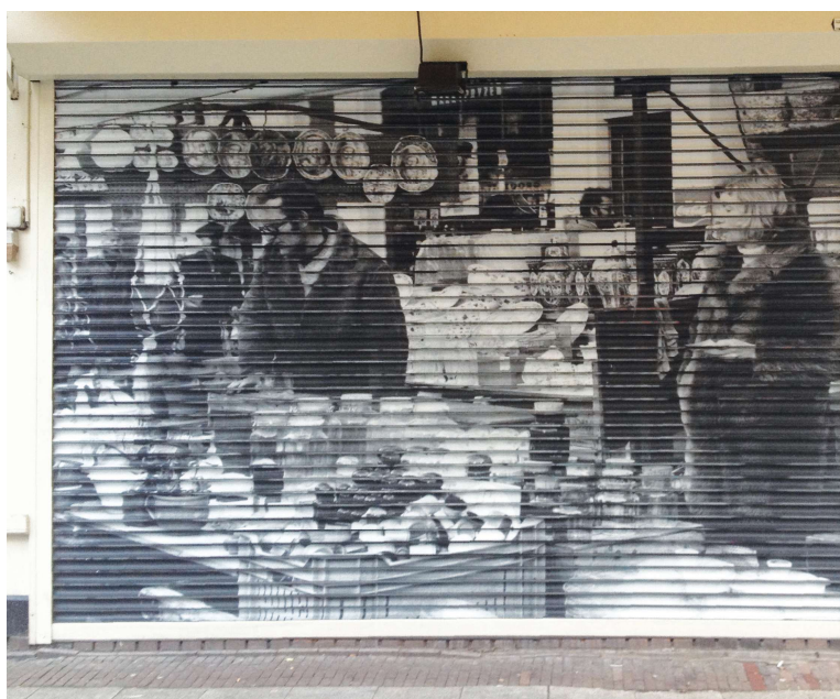
Tekst en Foto: Marnet Schoemaker