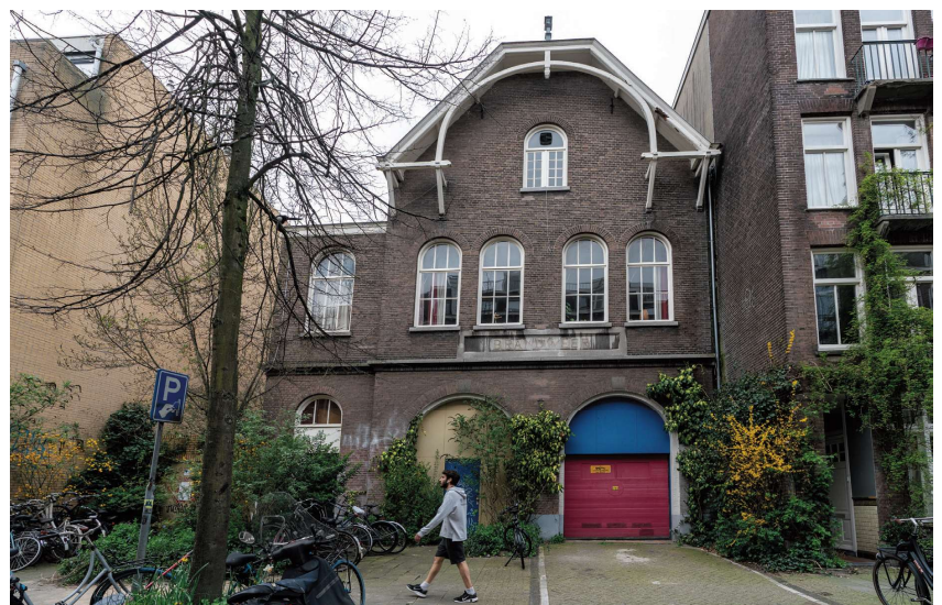
De brandweerkazerne nu

De meest spectaculaire brand waarvoor ze zijn uitgereden was de brand in het Paleis voor Volksvlijt op het Frederiksplein, 18 april 1929. Binnen de kortste tijd stond het gebouw in lichterlaaie. Het was een enorme vuurzee met hoog opblaiende oranjerode, donkerrode en zelfs groene vlammen, die over de hele stad zichtbaar waren. De hevige vonkenregen veroorzaakte ook overal in de omgeving brandjes die men echter snel wist te blussen. Er was geen redden aan en binnen één nacht tijd was er alleen nog een rokende puinhoop. Een brandweerman uit de Van