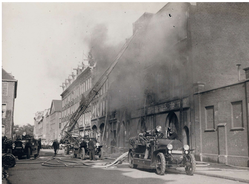
Brand in 'De Rookende Moor' in de Willibrordusstraat