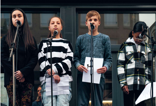
Kinderen lezen eigen gedichten voor op de herdenking